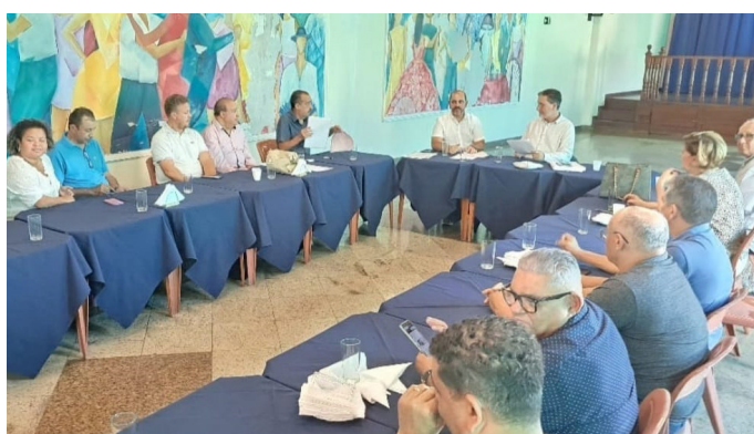
Sindicatos dos empregados em condomínios negociaram juntos

A inflação atual, acumulada em 4,06%, de acordo com o INPC/IBGE,