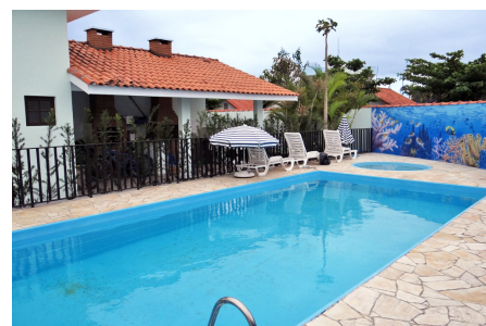
Colônia Beleza e Arte Caraguatatuba

Reservas e informações com o Seecethar: (18) 3621-1594. Reservas na colônia Beleza e Arte: (11) 3331-5866