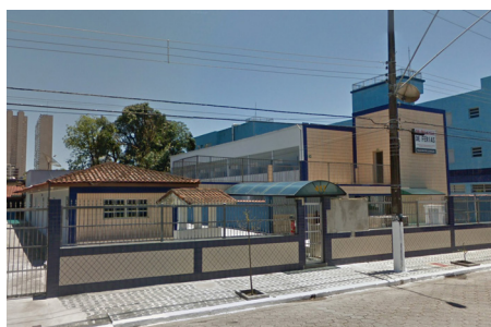
Colônia Petroleiros Praia Grande/SP