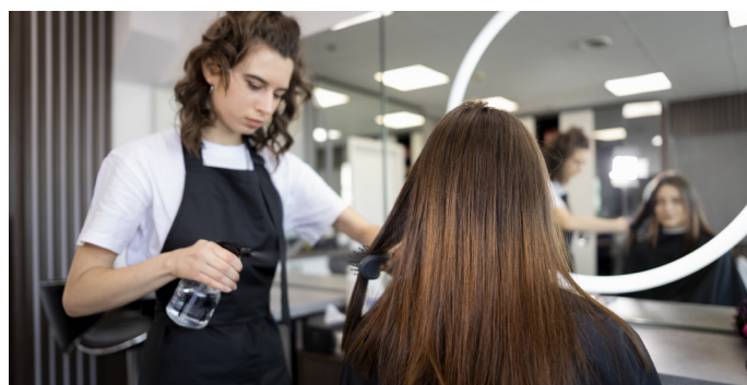
Categoria tem direito a abono e reajuste nos salários e Vale Cesta

Vale lembrar que os profissionais da beleza que trabalham sem vínculo em salões devem procurar o SEECETHAR o quanto antes para firmarem contrato de parceria, conforme a Lei 13.352/2016 (veja mais na pág 3).