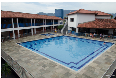
Colônia Sindifícios Caraguatatuba/SP